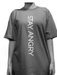
STAY ANGRY → 怒り続けよう