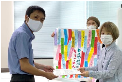
▲8月3日、立憲民主党奈良県総支部連合会に申入れ