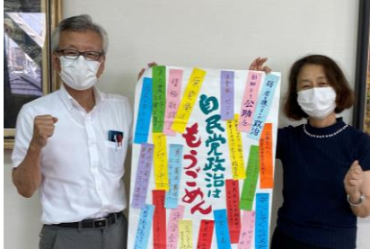
▲8月2日、日本共産党奈良県委員会に申入れ