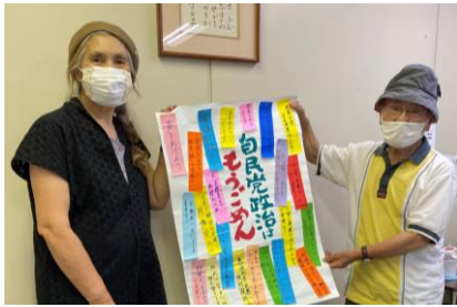
▲8月3日、新社会党奈良県本部に申入れ