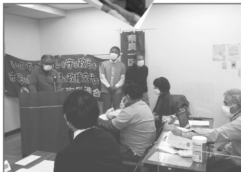
奈良2区市民連合の皆さん

★ 市民連合の皆さん全員が女性で、とても元気づけられました。選挙期間中に、維新や自民から盛んに流された「立憲と共産が共闘するのは野党」という攻撃に対して、野党側からたいした反論も出て来なかったのは残念でした。K・Y