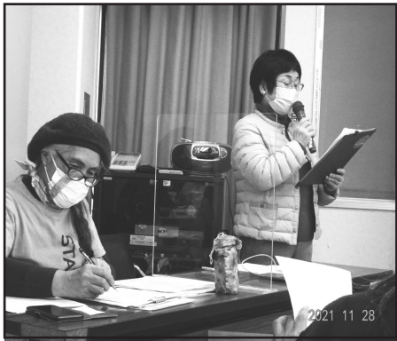
なんと総会では司会報告、開閉会挨拶も全員女性でした。