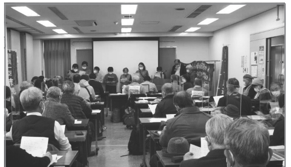
「日曜日には選挙に行こう」と歌うコールメーブルのみなさん