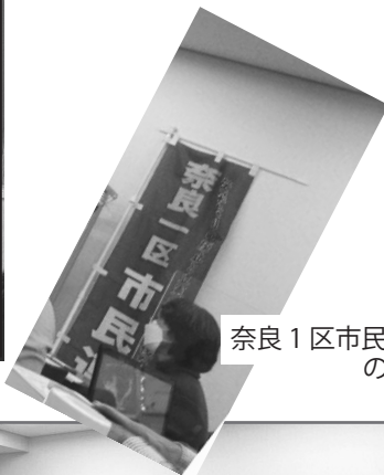
奈良1区市民連合の幟