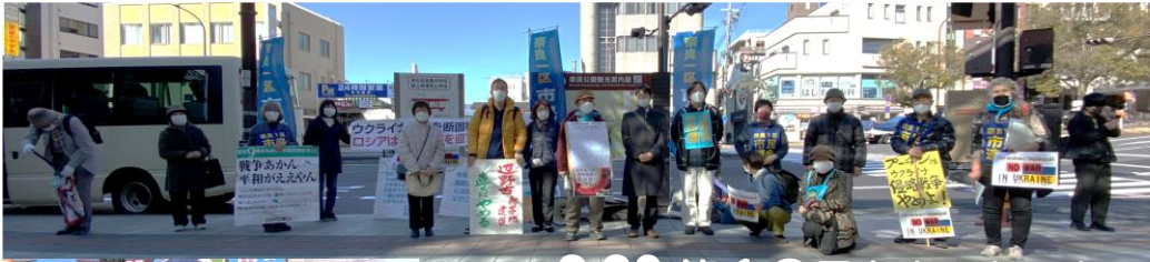
2.26 第13回タウントーク

第13回タウントークを2月26日の午後11時に近鉄奈良駅前で行いました。30人を超える参加で、昨年の秋の衆院選以来の本格的な街頭宣伝となりました。