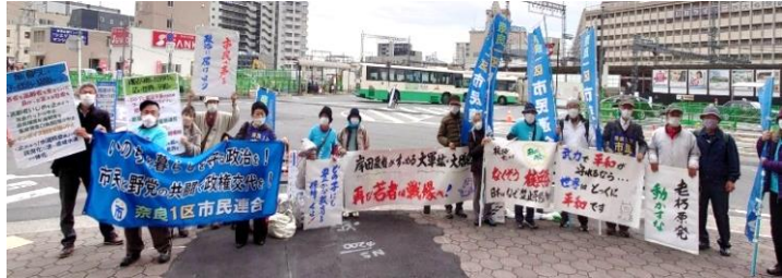
▲11月26日、30人を超える参加で第17回タウントークを行いました。

中にはボードをじっと見つめる人、「いいものもらった」と嬉しい反応を示す人もいました。20歳の若者たちが希望の持てる未来の実現を願いながら、10人が参加しました。