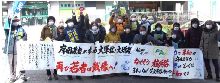
▲12月24日の第18回タウントークでは400枚のチラシを配布しました。

12月24日、近鉄学園前駅北口で第18回タウントークを行い、22人が参加しました。岸田政権が閣議決定した安部3文書は、戦後の安保政策を大転換し、空前の軍拡と「戦争国家づくり」を推し進めようとするものです。こうした極めて危険な情勢のもと、この日のタウントークでは、「戦争ではなく平和の準備をしよう」「戦争はしない、させない」「軍事費倍増させるよりも教育、医療、福祉の充実を」など7人の方から熱い思いの訴えが行われました。