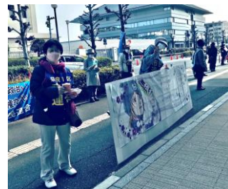
メッセージ入りティッシュなどの受け取りもよかったです。