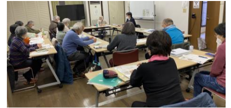
高の原・どんぐりの会