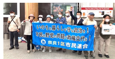
第30回タウントーク

第29回タウントークを近鉄学園前駅前で、第30回を近鉄奈良駅前で、どちらも20名が参加しました。