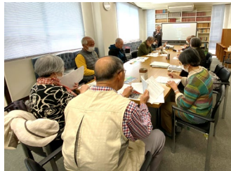
富雄・帝塚山地域交流会

【ならやまの会・高の原】 *4月22日、13:30～ 高の原駅前団地集会所で40名参加。