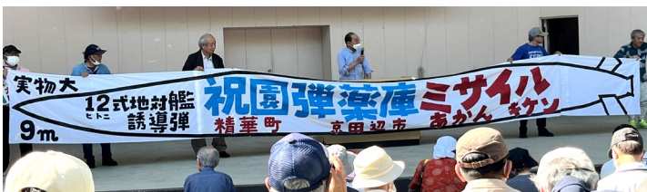
祝園ミサイル弾薬庫問題を考える住民ネットで作成した横断幕