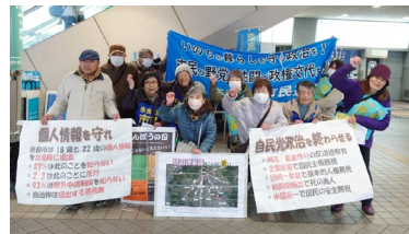
第29回タウントーク

第29回タウントークを近鉄学園前駅前で、第30回を近鉄奈良駅前で、どちらも20名が参加しました。